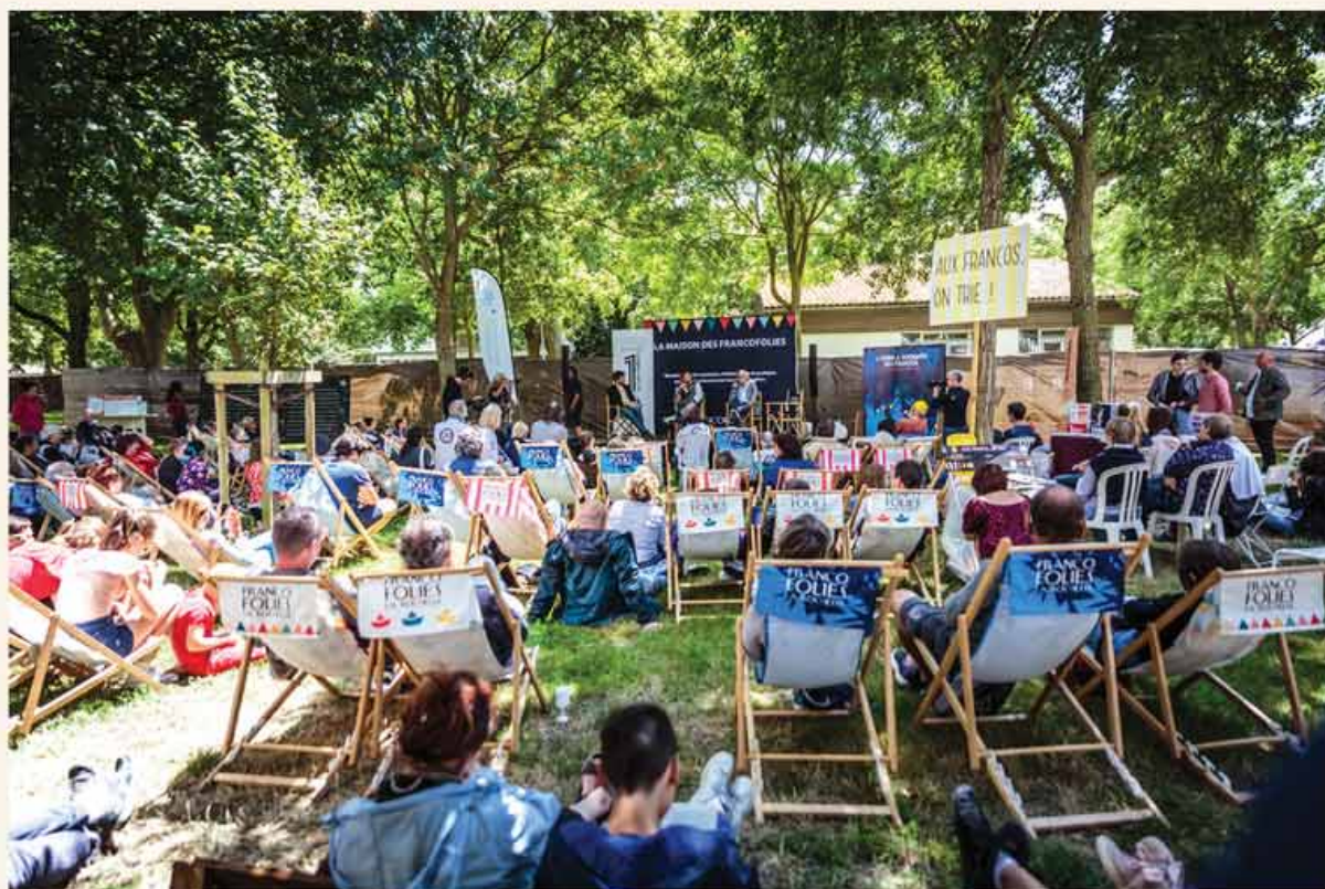
Conversations entre Daniel Auteuil et Yannick Bestaven - Francofolies 2021

Agissons ensemble. Menons ensemble le changement !