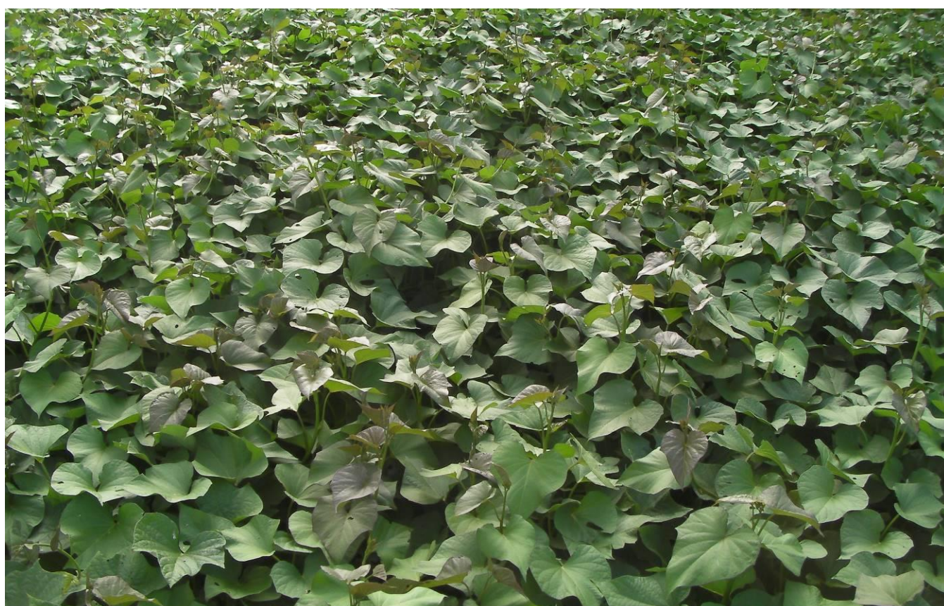
Culture de patates douces