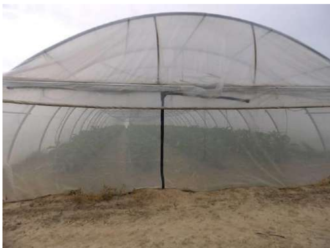
Fermeture sur abri tunnel

C'est une solution coûteuse et il faut avoir une étanchéité parfaite et une bonne aération de l'abri (ce qui n'est pas facile sur tous les abris). Par ailleurs, il faut bien maîtriser les populations résiduelles en associant les différentes techniques de lutttes (piégeage phéromones, panneaux chromatiques...) et bien refermer les accès lors des travaux dans les tunnels.