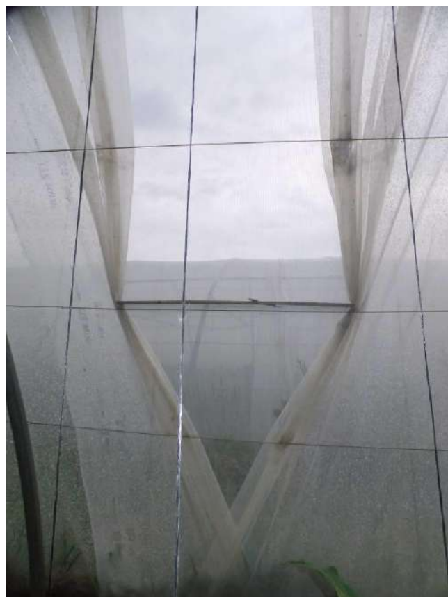
Filets positionnés au niveau des écarteurs de bâches