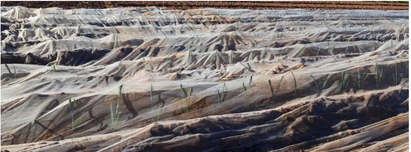
Filet posé sur une culture de poireaux