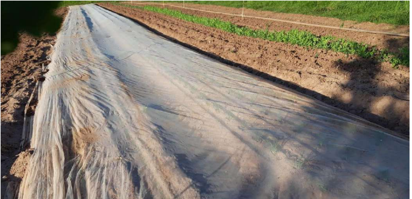
Filet posé sur une culture d'oignons